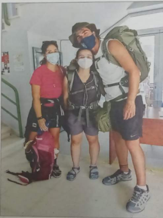
Tres de los participantes, en el albergue. // Itaki Abella

Destaca, aún así, que ahora mismo no está siendo para nada difícil la coordinación de un grupo de 16 personas, pues "con interés y ganas, además de unión y ayuda mutua, todo es posible", en palabras de la peregrina napolitana.