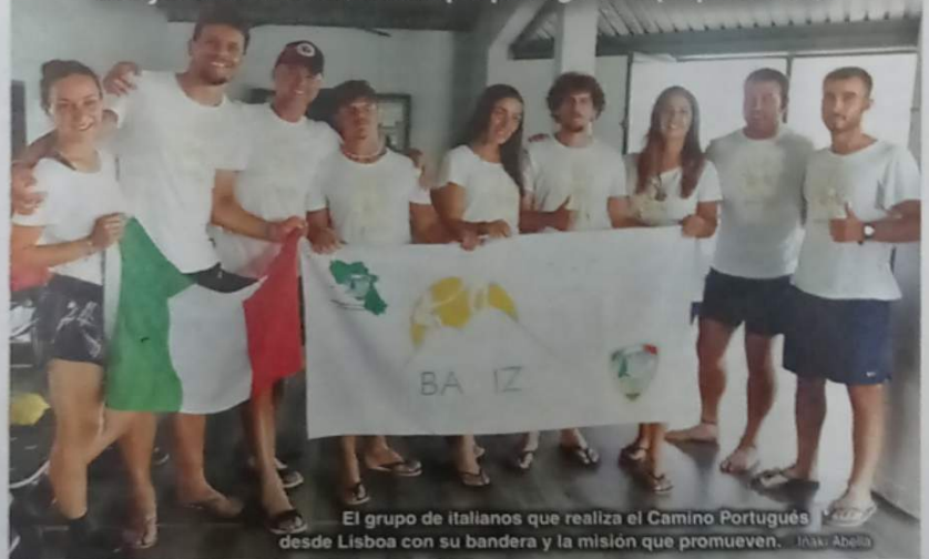
El grupo de italianos que realiza el Camino Portugués desde Lisboa con su bandera y la misión que promueven.

Un grupo de italianos recorre el Camino Portugués con el objetivo de ayudar a una asociación que protege a 50 pequeños / Pág. 4