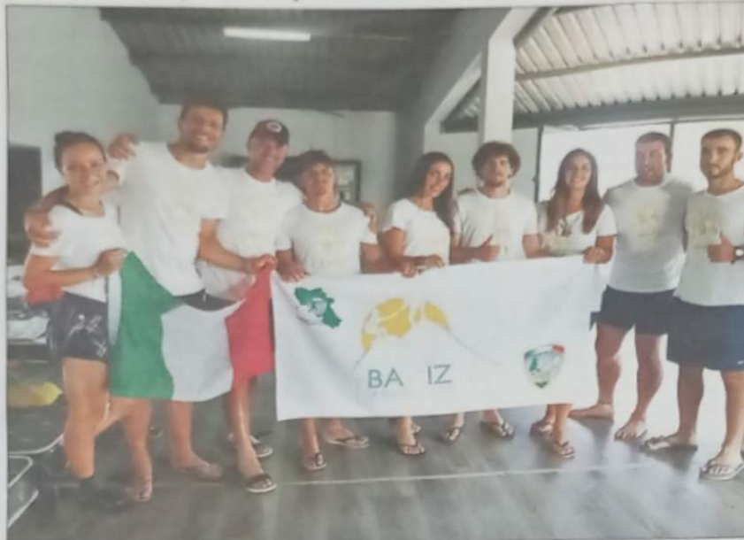
Los peregrinos italianos posan con la bandera y el objetivo de su misión.